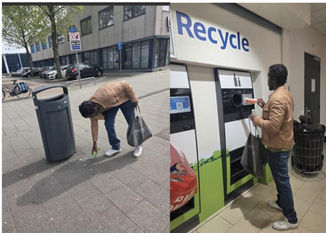
FIGUUR 6 INZAMELING STATIEGELD

Innocent verzamelt statiegeld flessen en blikjes voor Stichting Jyambere.