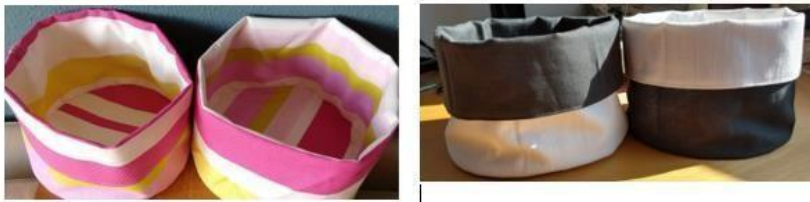
FIGUUR 5 BROODMANDJES

Mevrouw Sien maakt broodmandjes en verkoopt deze. De opbrengst is bestemd voor stichting Jyambere.