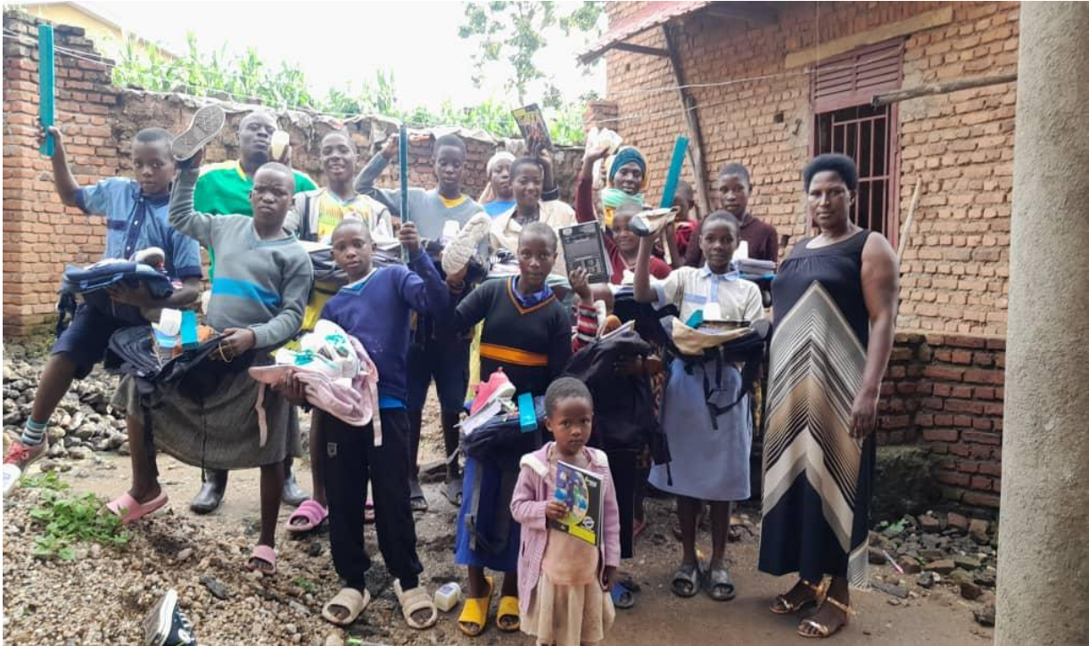
FIGUUR 3 BAHONEZA KINDEREN ONTVANGEN NIEUWE SCHOOLMATERIALEN OP 9 JANUARI 2025

Bahoneza is gevestigd in Rubavu. Omdat de situatie in Goma onvoorspelbaar blijft, heeft Jyambere besloten het aantal ondersteunde kinderen opnieuw te verhogen naar 22. In de toekomst kan dit aantal verder worden uitgebreid, afhankelijk van het aantal ongeleide kinderen uit Goma dat zonder hulp in de regio terechtkomt.