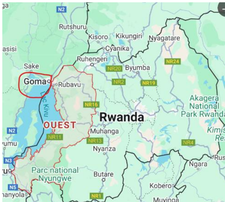
FIGUUR 1 GOMA STAD IN CONGO EN RUBAVU IN RWANDA