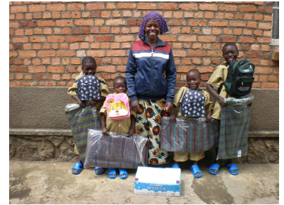
Links de kinderen voor hun school in Ruvuzananga, rechts kinderen met hun nieuwe spullen

In Nederland heeft Jyambere het afgelopen seizoen veel werk verricht en zijn goede resultaten geboekt. Begin oktober werd Jyambere vertegenwoordigd door haar vrijwilligers op de Trouw Idealendag in Amsterdam. Hier is veel geleerd van de ervaringen van soortgelijke organisaties en is contact gelegd met (overheid)instanties die goeddoelenorganisaties sponsoren. Aan het eind van deze dag hebben twee vrijwilligers van Jyambere aan een wedstrijd van NCRV programma Mamba Point deelgenomen om het leukste filmpje op te nemen omtrent een goeddoelenorganisatie. De hoofdprijs was een cursus "promotie film maken", welke door Jyambere is gewonnen! De onderstaande links verwijzen naar het filmpje dat op de Trouw Idealendag is gemaakt en het promotie filmpje dat werd gemaakt onder begeleiding van Mamba Point.